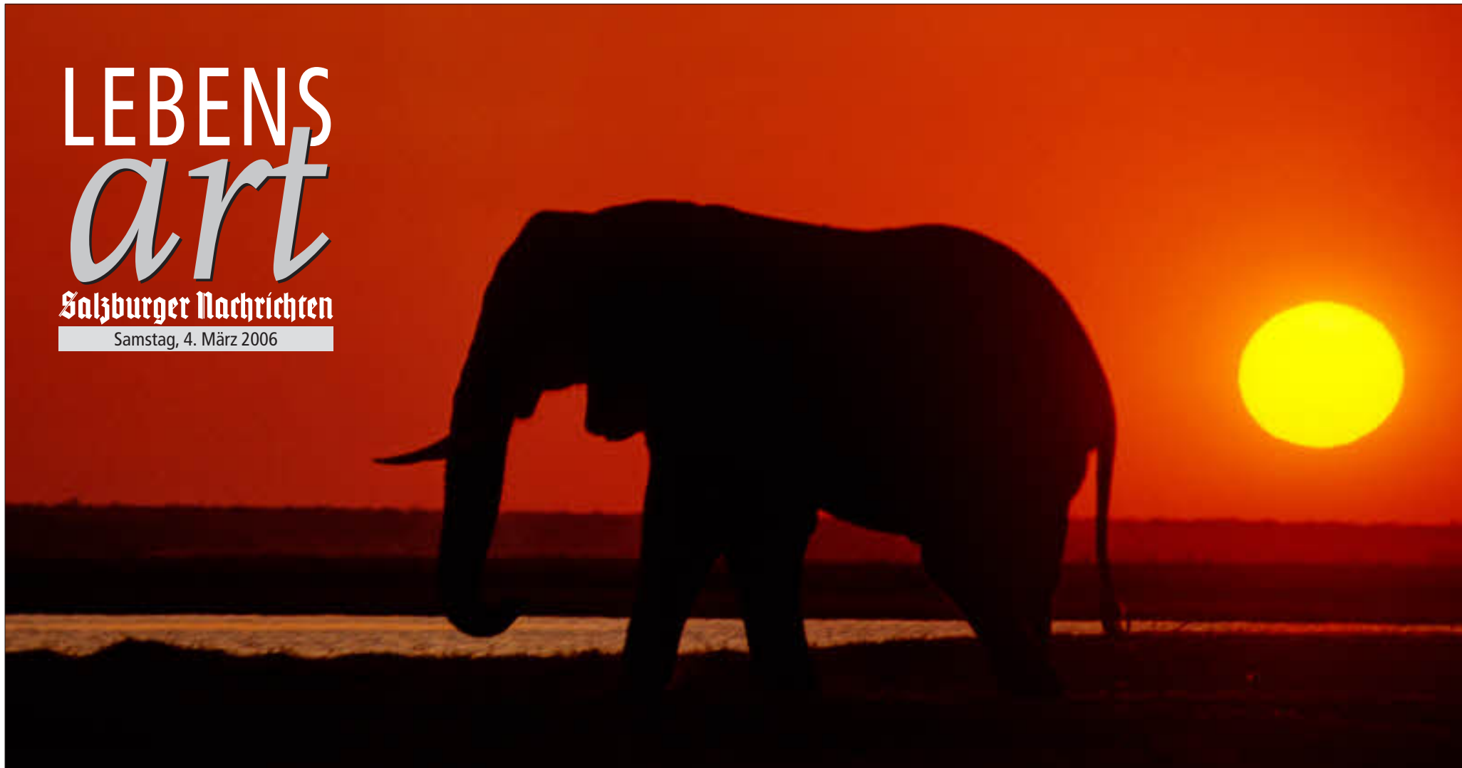
Die größte Attraktivität des Chobe Nationalparks im Nordwesten Botswanas besteht aus dem riesigen Elefantenbestand.