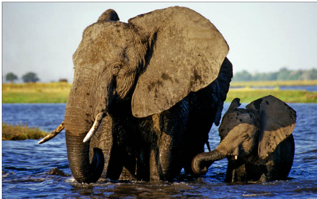
Chobe Elefanten geht es darum, zum Wasser zu gelangen, zu trinken, schwimmen oder den Fluss zu überqueren.

benden waren misstrauisch, durchbrachen immer wieder die Zäune des Parks und zerstörten die umliegenden Felder und Plantagen. Sie wussten ganz genau, wer ihre Artgenossen auf dem Gewissen hatte.