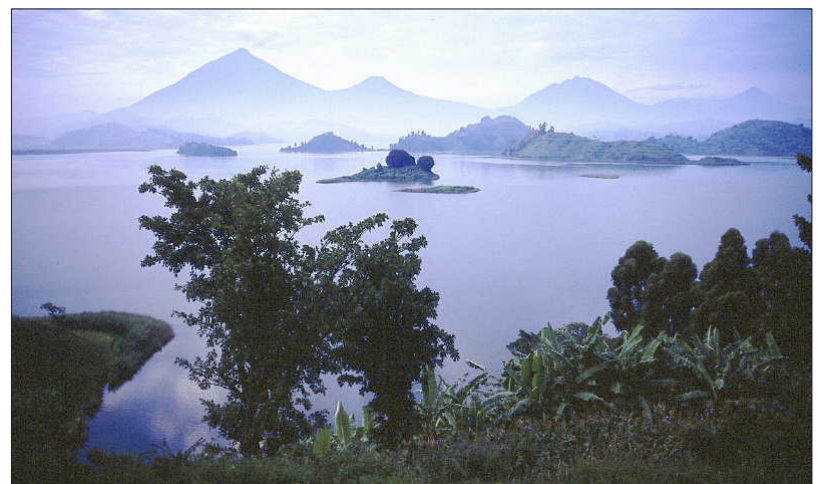
Vulkansee im Mgahinga Nationalpark, dahinter die Virunga Vulkane.