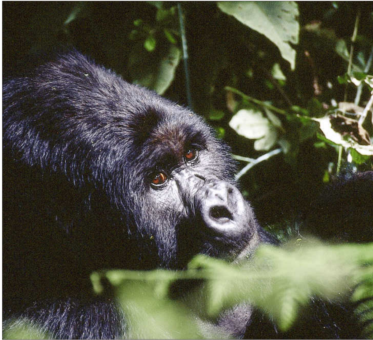
Junger Berggorilla bei der Mittagsruhe im Karisimbi Park.

Galapagos – die verzauberten Inseln. Chiang Mai – faszinierende Hauptstadt Nordthailands. Winterspaß daheim. Seiten XII–XIV